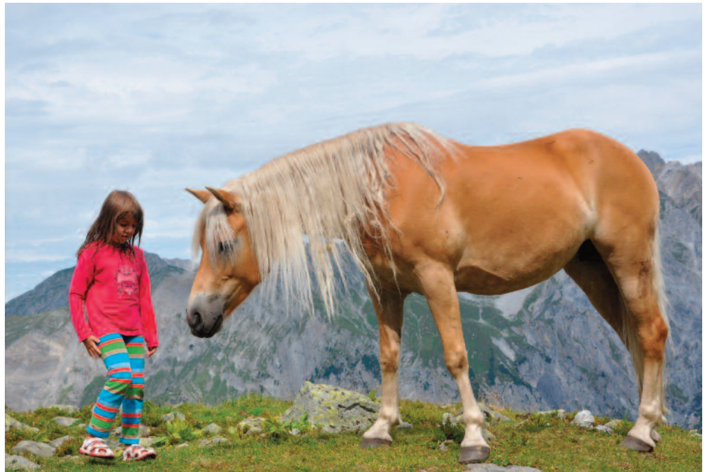
Mädchen speziell lieben die Haflinger – wie wahr!

Neben diesem „Großeinsatz“ warteten kleine Schönheitsreparaturen und der laufende Unterhalt wie Boden, Tisch und Herd scheuern und die Räume insgesamt gründlich zu säubern auf Erledigung. Das alles geht nicht ohne Möbel rücken vor und nach dem Putzen. Weiter muss die Hütte mit Holz versorgt und Müll aller Art abtransportiert werden. Irgendwo gilt auch