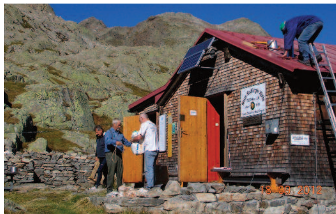
Der Kamin wird erneuert

„Verwall-Runde“ einen wesentlichen Beitrag zur Stärkung der eigenen Ertragskraft unserer Berghütten leistet, daran zweifelt keine der neun beteiligten Sektionen mehr. Trotz steigender Übernachtungszahlen gehört das Verwall immer noch zu den eher ruhigen und nicht überlaufenen Bergregionen im europäischen Alpenraum. Mit dem Projekt „Verwall-Kulinarisch“ wollen sich die Hütten im Verwall mit ihren jeweils besonderen und eigenen Gerichten ab der nächsten Bergsaison 2013 vorstellen und den Bergwanderern einen besonderen kulinarischen Genuss auf über 1000 Meter Höhe bieten.